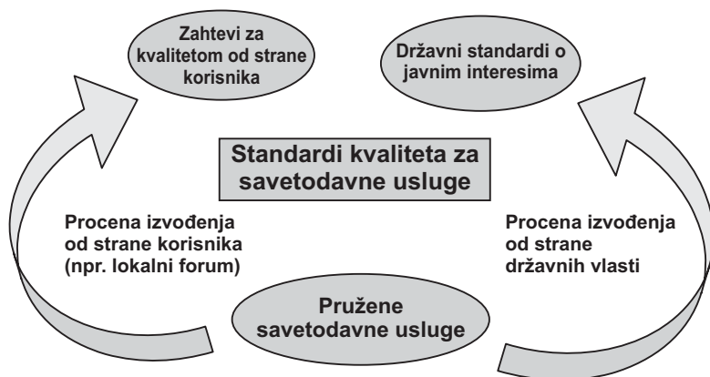
Slika 3 – Procena kvaliteta kod poljoprivrednih savetodavnih službi koje odgovaraju potrebama

Slika 3 pokazuje kako procena kvaliteta treba da se izvodi drugačije u zavisnosti od toga da li su uključeni privatni i/ili javni interesi.