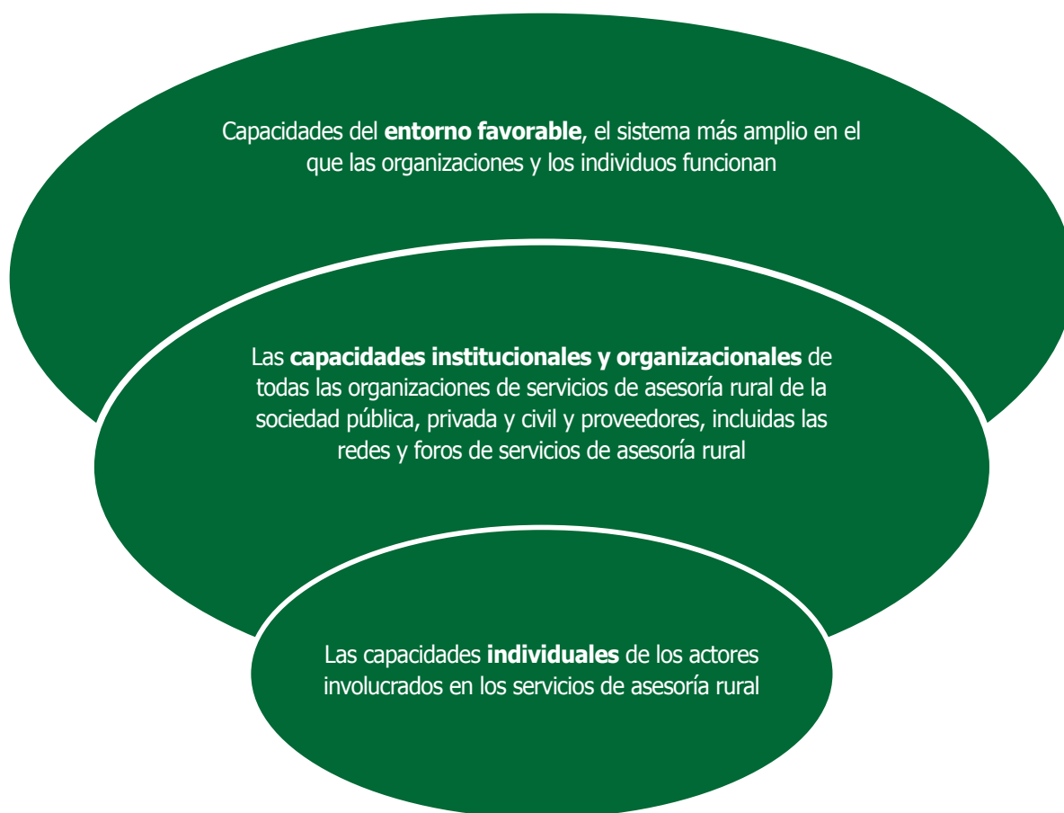
Figura 3. Niveles de desarrollo de capacidades

Adaptado de la FAO. 2010. Estrategia corporativa en el desarrollo de capacidades. Roma: Organización de las Naciones Unidas para la Agricultura y la Alimentación, p. 4.