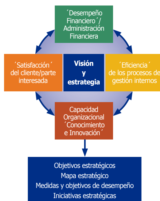
Figura C-1. Enfoque metodológico para la elaboración del marco estratégico

El enfoque se basó en la idea del equilibrio del cuadro de mando integral, 17 una herramienta estratégica muy conocida que analiza y coincide con cuatro niveles interrelacionados de una organización: la perspectiva del cliente, la perspectiva financiera, la perspectiva de aprendizaje y crecimiento y la perspectiva del proceso de negocios (Figura C-1).