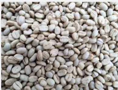
Granos secos de café