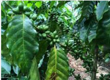
Granos de café verde